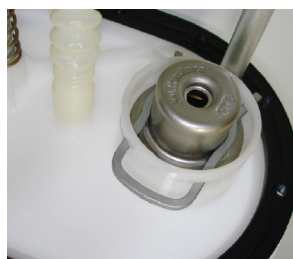
3 No módulo de combustível, junto à bomba de combustível (sistema multiponto returnless).