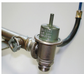
2 Na extremidade do tubo distribuidor (sistema multiponto).