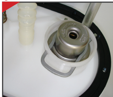
En el módulo de combustible, junto a la bomba de combustible (sistema multipunto returnless).