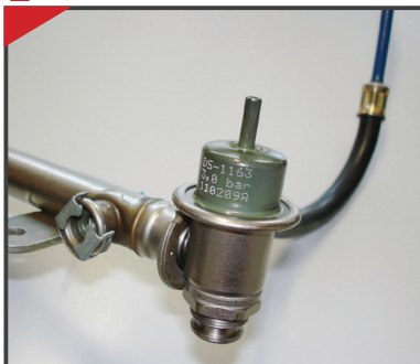
En la extremidad del tubo distribuidor (sistema multipunto).